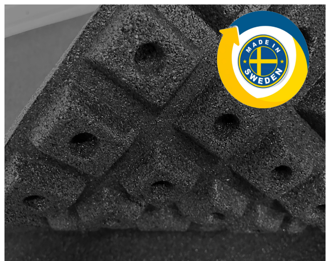
Mjuk, dämpande undersida